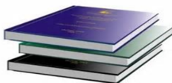
شکل ۱-۱ شرح شکل

به‌عنوان نمونه شکل (۱-۱) در زیر ارائه شده است.