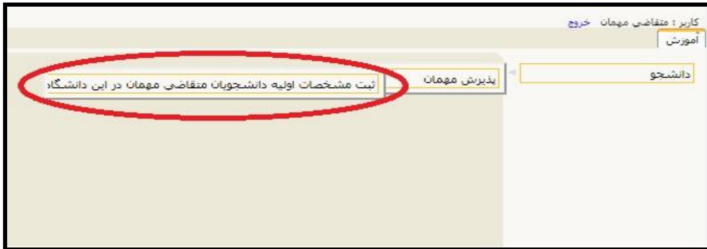
( تصویر شماره ۲ )

در صفحه ثبت مشخصات اولیه دانشجویان متقاضی مهمان در این دانشگاه ، اطلاعات بخش " تعهد نامه متقاضی مهمان " ، " مشخصات اولیه داوطلب " و " شناسه کاربری و گذرواژه مورد نظر " را با دقت تکمیل نموده و همچنین توضیحات مهم در پایین صفحه را با دقت مطالعه نمایید. ( تصویر شماره ۳ ) پس از تکمیل اطلاعات بر روی گزینه " ثبت موقت مشخصات متقاضی " کلیک نمایید. در صورتی که اطلاعات درخواستی را درست تکمیل کرده باشید پیام " اطلاعات با موفقیت ثبت گردید " را ملاحظه خواهید کرد و سیستم به طور اتوماتیک برای متقاضی شماره پرونده صادر خواهد کرد ( تصویر شماره ۴ )، پس از دریافت این پیام جهت تکمیل مراحل از سیستم خارج شوید.